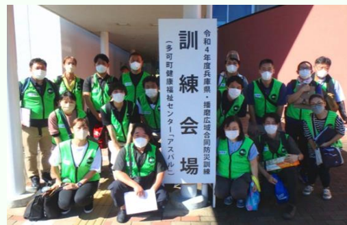
R4 年度兵庫県・播磨広域合防災訓練より